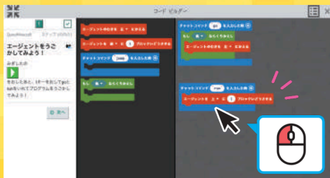
マウス操作が基本なので初心者でも安心!