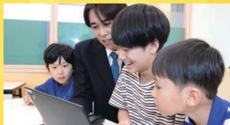
困った時には教室の先生が個別サポート!